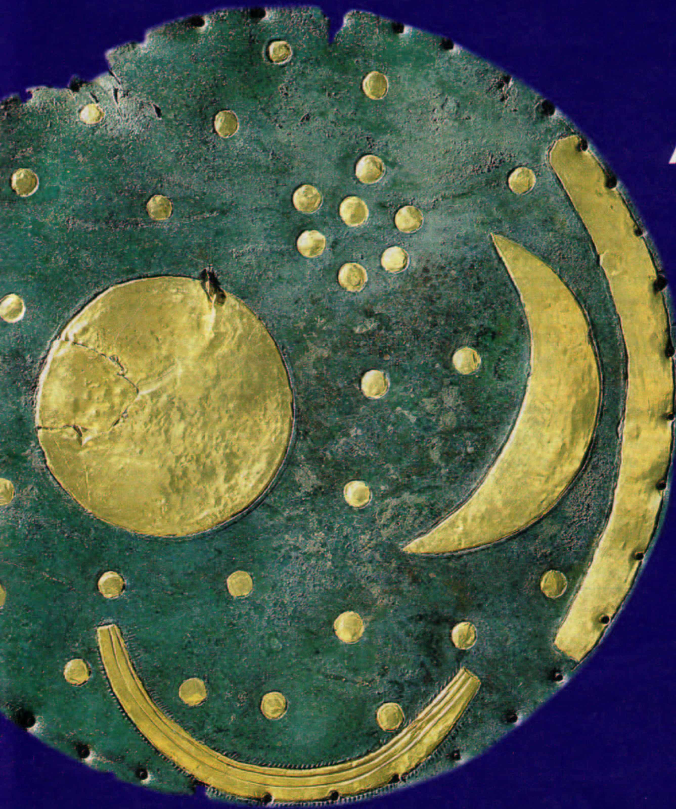
Ein Star aus der Vergangenheit: Die Himmelscheibe von Nebra